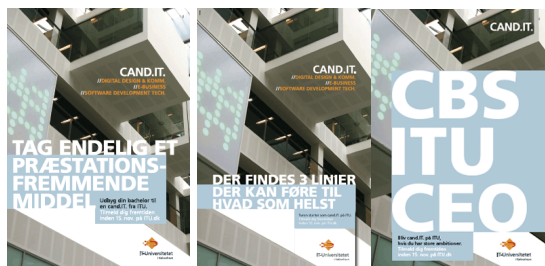
Cand it-kampagne: Plakat 1 : Hænger Fitnesscentre. Plakat 2 i busser. Og plakat 3 på CBS.